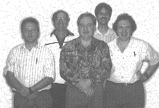
Élections au Bureau du SPSI

Pour participer, envoyez vos textes correspondants aux chiffres indiqués dans les bulles avant le 15 novembre 1996, par télécopieur au 449-9631 ou par courrier électronique à secretariat@spsi.qc.ca . N'oubliez pas d'inscrire vos nom et numéro de téléphone. Le meilleur dialogue sera publié dans notre prochaine édition.