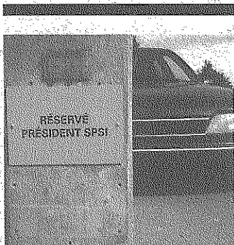
Une photo vaut mille mots!

Une photo vaut mille mots, dit-on! C'est donc un moment historique pour l'IREQ. Nous espérons obtenir l'équivalent pour notre futur(e) rédacteur(trice) en chef, avis aux intéressé(e)s!